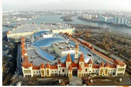
Тематический парк развлечений «Остров Мечты»