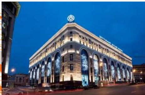
Торговый комплекс «Детский мир»