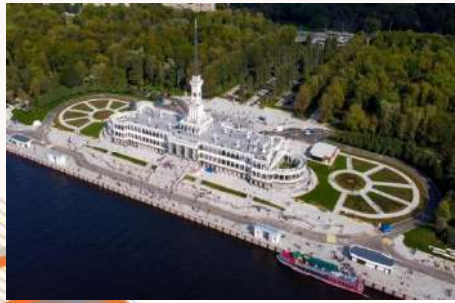
Здание Северного речного вокзала