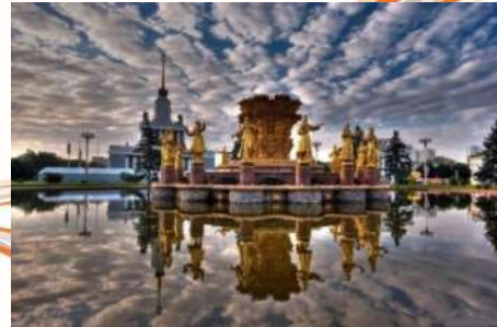
Объекты реконструкции ВДНХ