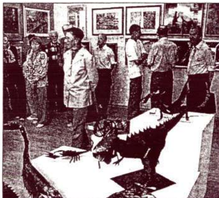
Композиции из металла студентов ИГСУ.

В эти дни область живет под знаком своего девяностолетия. В празднование юбилея Иваново-Вознесенской губернии свой вклад внесли и художники. Выставка, собравшая в своей экспозиции произведения мастеров разных поколений, открыта в Большом зале Ивановской организации ВОО «Союз художников России».