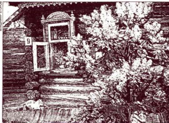
С.Ковалев. «Славный день мая».