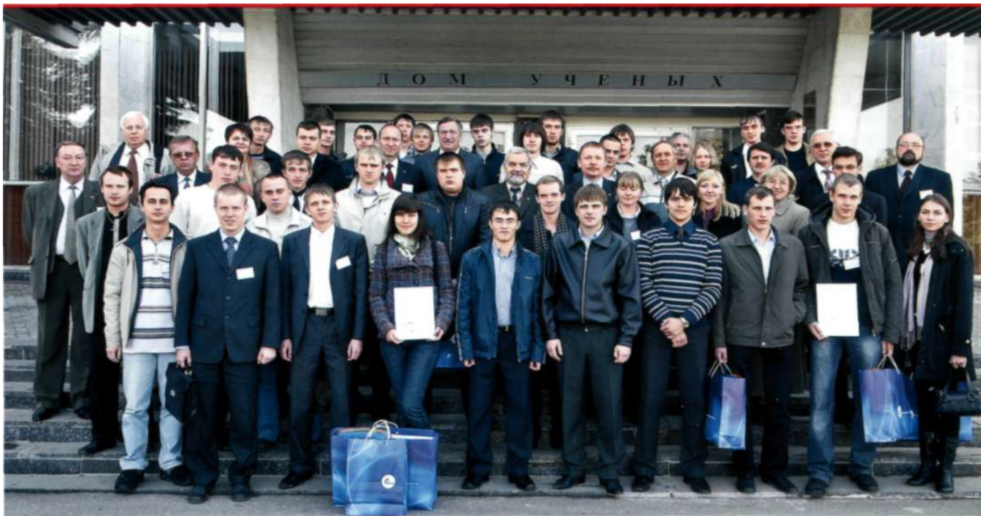
Участники итоговой конференции конкурса научных работ студентов Обнинского государственного технического университета атомной энергетики

Вторым направлением является работа со студентами образовательных учреждений высшего и среднего профессионального образования. В этом случае главной задачей является привлечение выпускников профильных вузов и техникумов к работе на атомных станциях. Практически на всех атомных станциях Концерна работники