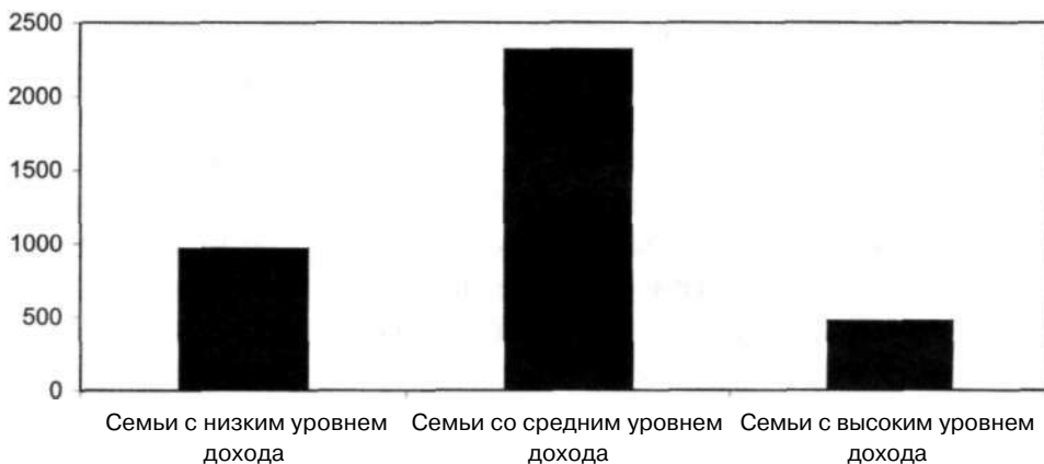
Рис. 1. Распределение домохозяйств по доходным группам (2005/2006 учебный год)

Авторы характеризуют домохозяйства, выбравшие варианты а) и б), как группу семей с низким доходом, в) и г) - как группу семей со средним доходом и д) и е) - как группу семей с высоким доходом. Это дает возможность отдельно оценить эффекты различных факторов непосредственно на студентов из семей с низким или высоким доходом и сравнить их с контрольной группой домохозяйств со средним доходом. Использование данного критерия вместо традиционной классификации (по доходам) объясняется следующим. Подобное деление домохозяйств с учетом их покупательной способности позволяет нам избежать корректировки доходов в связи с различиями уровня цен в регионах. Распределение семей из выборки по доходным группам представлено на рис. 1.