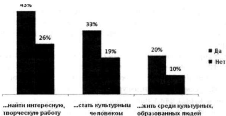
Рис. 3. Семьи со средним уровнем дохода, чьи дети посещали языковые курсы (2005/2006 учебный год)

Что же касается учащихся языковых курсов, то их следует рассматривать как представителей «творческого» класса домохозяйств. На рис. 3 проиллюстрировано представление о роли высшего образования в таких домохозяйствах: они более заинтересованы в «культурном потреблении». С одной стороны, они считают, что высшее образование играет важную роль в этом процессе, с другой - они ограничены в средствах по сравнению с семьями с высоким уровнем дохода. И поэтому они хотят получить кредит для оплаты высшего образования.