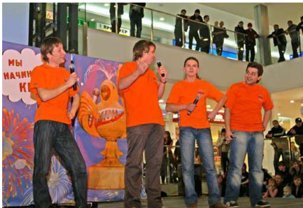
Команда ИГХТУ «Химики»

Следующая игра, ¼ финала, пройдет 28 марта в актовом зале ИГЭУ, за что организаторы выражают благодарность ивузи огромную благодарности. Подвести итоги в мартовском номере уже не удастся: в это время он будет находиться в печати. Результаты – в апрельском номере «Всегда в движении», а также в других печатных изданиях региона. Проведение следующих игр – ½ финала –